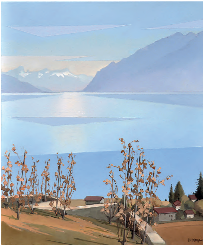
Jean-Pierre Magnin, «Dernières feuilles avant l'hiver», huile, 60 x 50 cm

«La mission de l'art n'est pas de copier la nature mais de l'exprimer.»