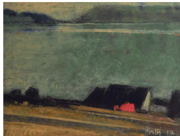
" Léman calme, vu de Lavaux ", craie, 49 x 64 cm