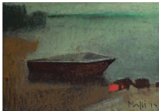
" Bateau, lac de Bret ", huile , 49 x 64 cm

LA GALERIE LES 3 SOLEILS, EPESES, PRÉSENTE